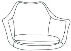
Cuerpo de la silla